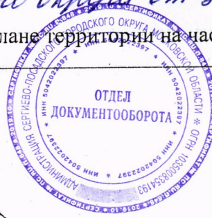
Схема границ сервитута на кадастровом плане территории на часть земельного участка

Утверждена постановлением администрации Сергиево-Посадского городского округа от 30.06.2022 № 938-17А