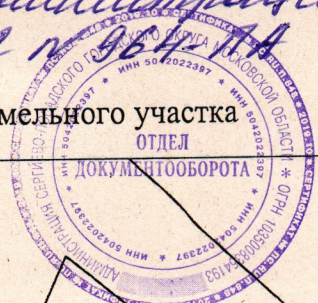
Схема границ сервитута на кадастровом плане территории на часть земельного участка

Утверждено постановлением администрации Сергиево-Полодского городского округа от 05.04.2012 № 964-ПА