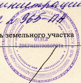
Схема границ сервитута на кадастровом плане территории на часть земельного участка

Утверждена постановлением администрации Сергиево-Посадского ЦР от 05.04.2014 года № 965-ПН