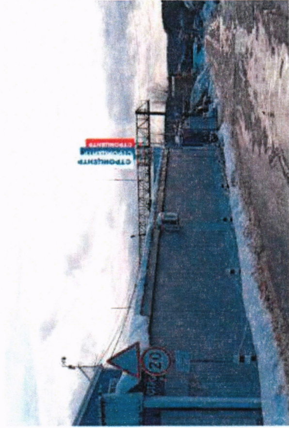
*№ 617 Сторона Б (против хода движения)

Адрес: г. Сергиев Посад, ул. Центральная, д.1б