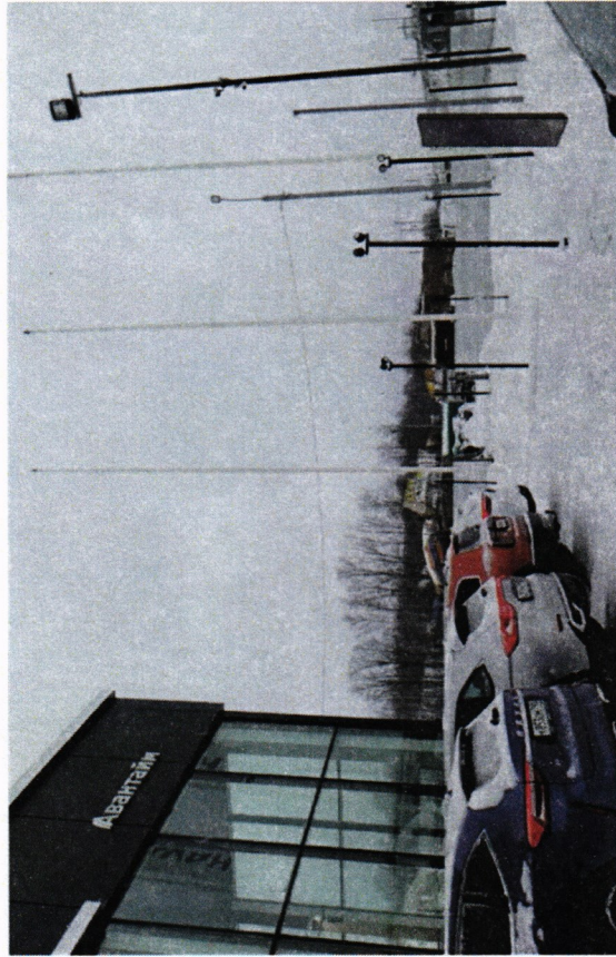
*№ 616 Сторона А (по ходу движения)

к постановлению главы Сергиево - Посадского районного округа от 10.04.2024 № 224-П/Г