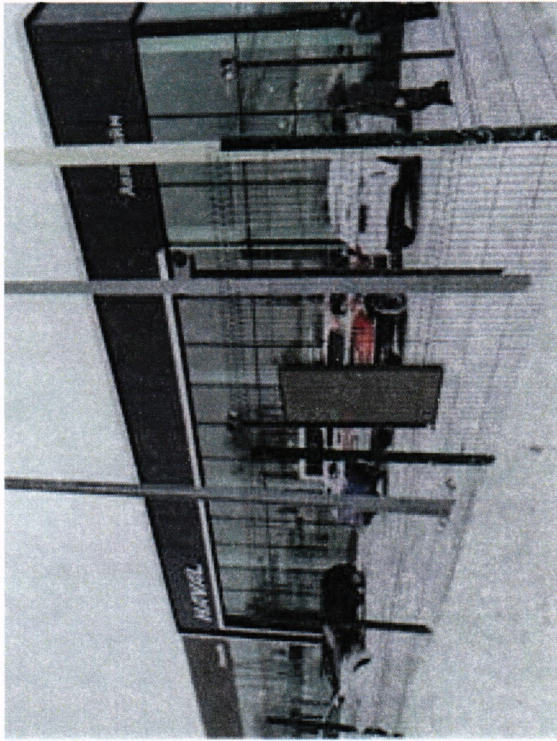
*№ 616 Сторона Б (против хода движения)

Адрес: г. Сергиев Посад, Новоуличское ш., з/у 87