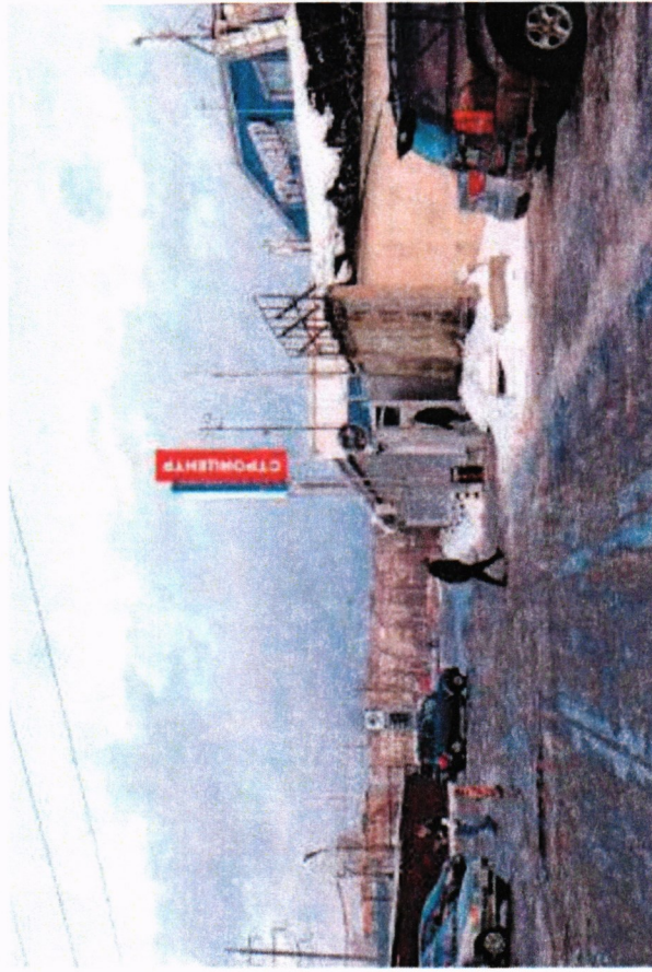
*№ 617 Сторона А (по ходу движения)